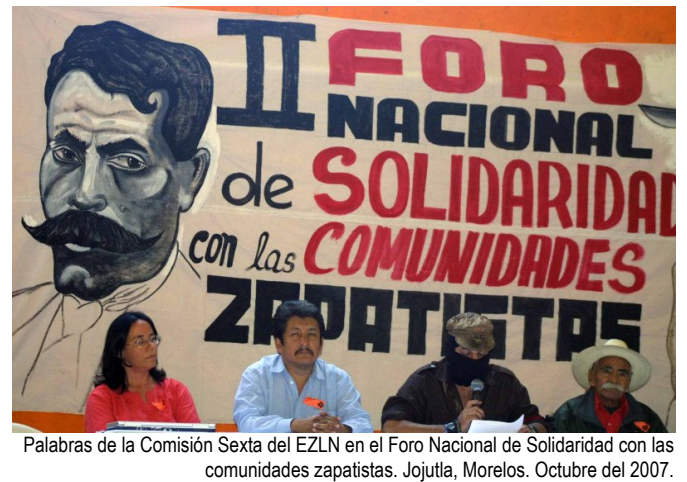
Palabras de la Comisión Sexta del EZLN en el Foro Nacional de Solidaridad con las comunidades zapatistas. Jojutla, Morelos. Octubre del 2007.