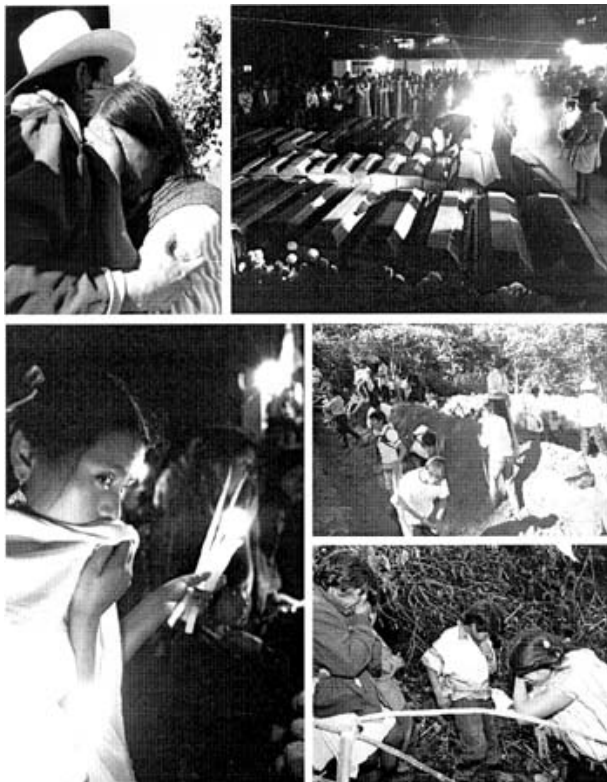
(CCIODH) Octubre de 2007

El 22 de diciembre de 1997 un grupo paramilitar disparó de manera indiscriminada en el interior de una iglesia de la comunidad de Acteal, Chiapas. Las balas se llevaron la vida de 45 indígenas tzotziles: 16 niñas, niños y adolescentes, 20 mujeres y 9 hombres. 7 de las mujeres estaban embarazadas.