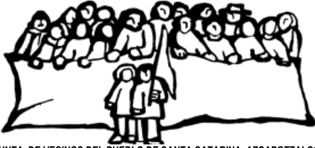
JUNTA DE VECINOS DEL PUEBLO DE SANTA CATARINA, AZCAPOTZALCO.