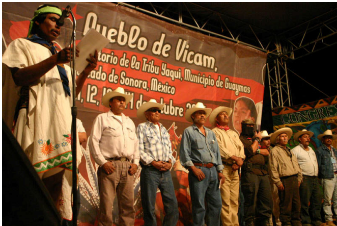
Vicam, territorio Yaqui, Sonora, México. 14 Octubre del 2007.

AUTORIDADES TRADICIONALES DE LA TRIBU YAQUI EN VICAM: LÍDERES, REPRESENTANTES, DELEGADOS, AUTORIDADES DE LOS PUEBLOS ORIGINARIOS DE AMÉRICA PRESENTES EN ESTE PRIMER ENCUENTRO DE LOS PUEBLOS INDIOS DE AMÉRICA: HOMBRES Y MUJERES, NIÑOS Y ANCIANOS DE LA TRIBU YAQUI: OBSERVADORES Y OBSERVADORAS DE MÉXICO Y EL MUNDO: TRABAJADORAS Y TRABAJADORES DE LOS MEDIOS DE COMUNICACIÓN: HERMANAS Y HERMANOS: