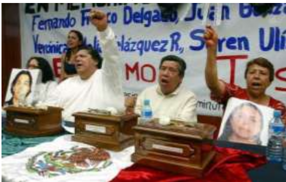
Por: Jorge Gómez Barata (especial para ARGENTPRESS info, 18/03/2008)

El que un guerrillero muera en combate en una selva, de un lado u otro de cualquier frontera es un riesgo calculado y de cierta manera un hecho tan natural como el que jóvenes de cualquier país se interesen e incluso se sumen a este tipo de lucha. Otra cosa es que se les ultime en nombre de exóticas doctrinas de seguridad como le ha ocurrido con un grupo de estudiantes mexicanos.