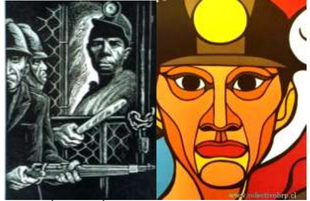
MINERA MÉXICO VACÍA SUS OFICINAS, ANTE LA LLEGADA DE LA CARAVANA DE APOYO A LAS FAMILIAS DE PASTA DE CONCHOS

La " Segunda Caravana de la sociedad civil al encuentro de las familias de Pasta de Conchos " hizo su arribo el día de hoy lunes por la mañana a la región carbonífera de Coahuila, para encontrarse con las familias de los mineros que perdieron la vida en febrero de 2006 y cuyos restos aún se encuentran dentro de la Mina 8, unidad Pasta de Conchos.