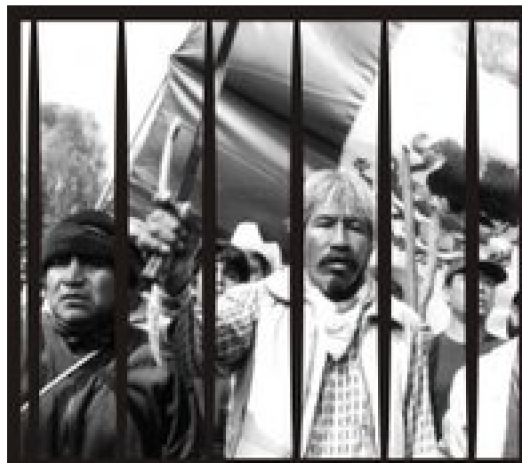
POSTURA DEL FRENTE DE PUEBLOS EN DEFENSA DE LA TIERRA

El día de hoy es de noticias que nos indignan y nos llenan de coraje, rabia, pero no nos vamos a callar.