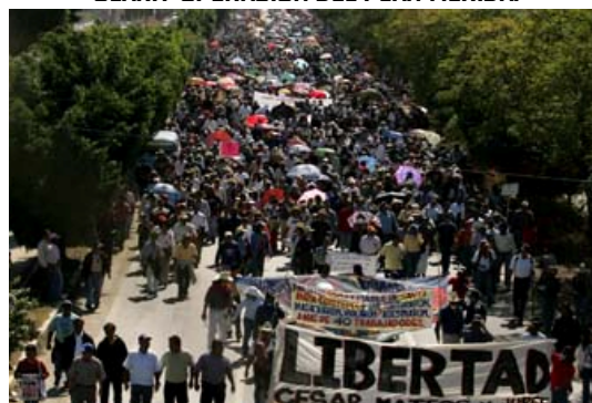
Oaxaca de Juárez, Oax., a 8 de agosto de 2008.

A LOS PUEBLOS DE OAXACA, MÉXICO Y EL MUNDO A LOS HOMBRES Y MUJERES DE BUEN CORAZÓN A LOS MEDIOS DE COMUNICACIÓN HONESTOS A LAS ORGANIZACIONES DE LOS DERECHOS HUMANOS