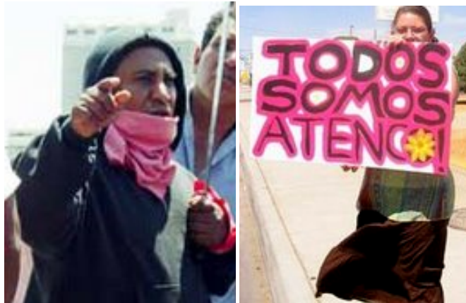
COMISIÓN SEXTA DEL EZLN. México, 11 de septiembre del 2008

A LAS COMPAÑERAS, COMPAÑEROS Y COMPAÑEROAS ADHERENTES A LA SEXTA DECLARACIÓN, DE LA OTRA CAMPAÑA Y DE LA ZETA INTERNACIONAL: A QUIEN SE SIENTA ALUDIDA, ALUDIDO Y ALUDIDO: