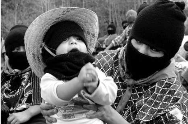
Tonalá, Chiapas a 13 de septiembre de 2008

A LA OTRA CAMPAÑA NACIONAL, A LA ZEZTA INTERNACIONAL, A LA COMISIÓN SEXTA DEL EZLN, A LAS ORGANIZACIONES SOCIALES Y ONG, A LOS DEFENSORES DE LOS DERECHOS HUMANOS, A LOS MEDIOS DE COMUNICACIÓN ALTERNATIVOS, A LOS MEDIOS DE COMUNICACIÓN MASIVOS, HERMANOS Y HERMANAS: