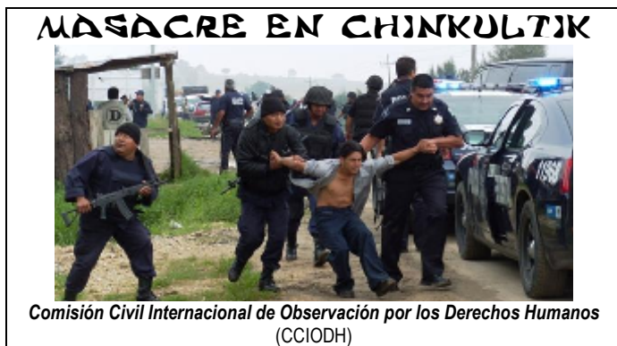
Comisión Civil Internacional de Observación por los Derechos Humanos (CCIODH)

El pasado 3 de octubre, se llevó a cabo un operativo policial en la comunidad de Miguel Hidalgo, municipio de la Trinitaria (Chiapas) en el que participaron elementos de seguridad pública, y Procuración de Justicia a nivel estatal y federal para ejecutar diferentes órdenes a partir de la averiguación previa con motivo de la toma del predio del centro ceremonial de Chinkultik por parte de la comunidad.