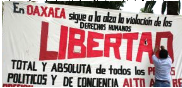
Ricardo Flores Magón. 1911.

PARA EL PUEBLO NO HAY JUSTICIA PRECISAMENTE PORQUE ES POBRE Y LA LEY SÓLO SIRVE, PARA VEJAR Y DESPRECIAR AL POBRE.