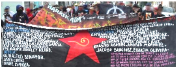
COMITÉ DE DEFENSA DE LOS DERECHOS DE LA MUJER, COMITÉ DE DEFENSA DE LOS DERECHOS DEL PUEBLO, ASAMBLEA POPULAR DE LOS PUEBLOS DE OAXACA.

El autoritarismo que ha caracterizado a los gobiernos ilegítimos de Felipe Calderón y Ulises Ruiz Ortiz se ha agudizado en Oaxaca, el gobierno ha implementado operativos policíacos y parapolicíacos, en contra de integrantes de la APPO, bajo la supuesta lucha del combate al narcotráfico y la delincuencia organizada así como lo demuestran, los siguientes hechos: