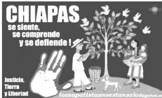
Chiapas, México. 22 de enero de 2009

A LOS COMPAÑEROS Y COMPAÑERAS DE LA SEXTA INTERNACIONAL. A LOS COMPAÑEROS Y COMPAÑERAS DE LA OTRA CAMPAÑA NACIONAL E INTERNACIONAL. A LOS COMPAÑEROS Y COMPAÑERAS DE LOS MEDIOS ALTERNATIVOS. A LOS HERMANOS Y HERMANAS DE MÉXICO Y EL MUNDO. A LOS ORGANISMOS DE DERECHOS HUMANOS NO GUBERNAMENTALES.