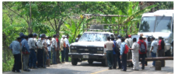
Martes, 21 de abril de 2009

A LOS MEDIOS INDEPENDIENTES NACIONAL E INTERNACIONAL. A LAS ORGANIZACIONES NO GUBERNAMENTALES NACIONAL E INTERNACIONAL. A LOS ADHERENTES DE LA OTRA CAMPAÑA NACIONAL E INTERNACIONAL A LOS HERMANOS SOLIDARIOS NACIONAL E INTERNACIONAL AL PUEBLO DE MÉXICO Y DEL MUNDO.