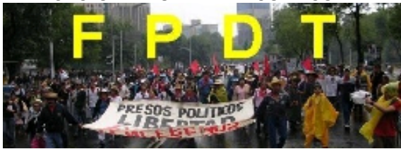
San Salvador Atenco, 3 de mayo de 2009.

AL CCRI-CG DEL EZLN, A LA COMISIÓN SEXTA. A LAS JUNTAS DE BUEN GOBIERNO, A LAS BASES DE APOYO. AL ZAPATISMO TODO. HERMANAS Y HERMANOS.