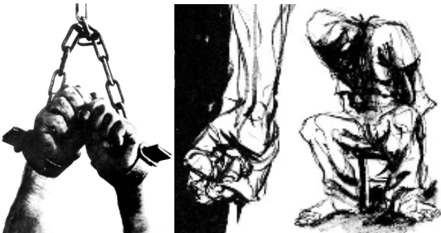
México DF 19 de junio del 2009

Son pocos los hombres hoy en día que luchan por cambiar las condiciones de vida de las personas. Existen hombres que subsisten con su trabajo diario para llevar el sustento a sus familias y así poder sobrevivir, y existen "hombres" criminales y asesinos que arrebatan a padres de familia de sus hogares.