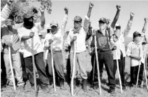
La Realidad, 8 de septiembre del 2009