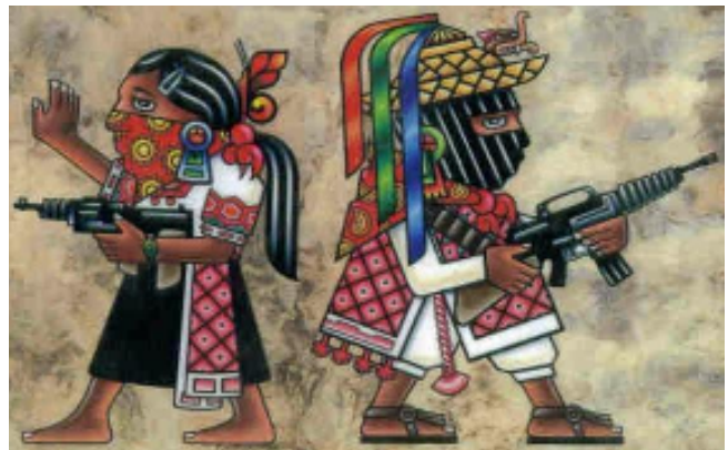
(EDUARDO GALEANO, ESCRITOR URUGUAYO)

Quando una comunidad se portaba mal, y se negaban sus hombres a ser esclavos de las haciendas, la tropa se los llevaba -y nunca más-. Hartos de morir por bala o hambre, los indígenas se armaron. Con más palos que fusiles, pero se armaron.