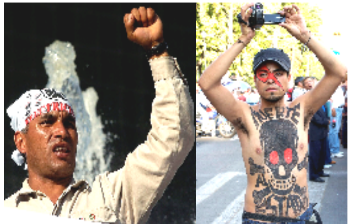
A. HEKSHEN, Lima, 1 de mayo de 1920.

Publicado en "El Obrero Textil" en la primera quincena de julio de 1920.