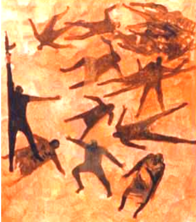
(José Saramago, escritor portugués)

Toda sangre tiene su historia. Corre sin descanso en el interior laberíntico del cuerpo y no pierde el rumbo ni el sentido, enrojece de súbito el rostro y lo empalidece huyendo de él, irrumpe bruscamente de un rasguño de la piel, se convierte en capa protectora de una herida, encharca campos de batalla y lugares de tortura, se transforma en río sobre el asfalto de una carretera. La sangre nos guía, la sangre nos levanta, con la sangre dormimos y con la sangre despertamos, con la sangre nos perdemos y salvamos, con la sangre vivimos, con la sangre morimos. Se convierte en leche y alimenta a los niños en brazos de las madres, se convierte en lágrima y llora sobre los asesinados, se convierte en revuelta y levanta un puño cerrado y un arma.