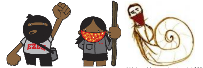
México, 14 de noviembre del 2009.

LA JBG DE ROBERTO BARRIOS DENUNCIA AL MAL GOBIERNO POR AGRESIONES DE GRUPOS ARMADOS PARAMILITARES EN LA ZONA NORTE. CARACOL V QUE HABLA PARA TODOS, JUNTA DE BUEN GOBIERNO NUEVA SEMILLA QUE VA A PRODUCIR. ROBERTO BARRIOS, CHIAPAS.