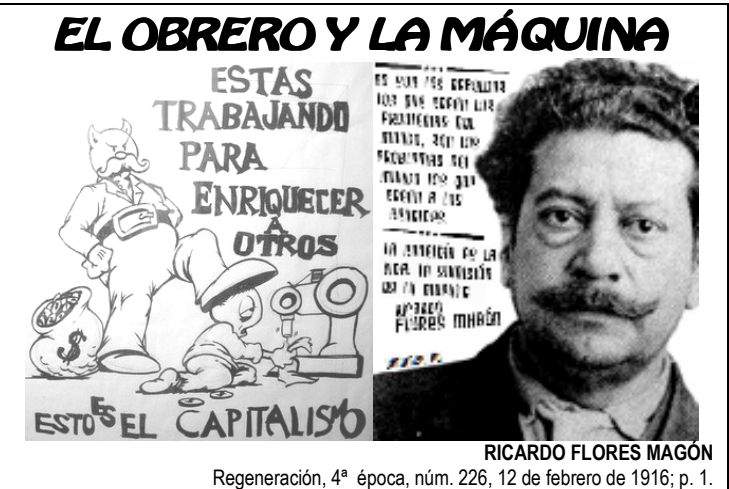
Regeneración, 4ª época, núm. 226, 12 de febrero de 1916; p. 1.

—¡Maldita máquina! -exclama el obrero sudando de fatiga y de congoja-. —¡Maldita máquina, que me haces sufrir tus rápidos movimientos como si yo fuese, también, de acero, y me diera fuerza un motor! Yo te detesto, armatoste vil, porque haciendo tú el trabajo de diez, veinte o treinta obreros, me quitas el pan de la boca y condenas a sufrir hambre a mi mujer y a mis hijos.