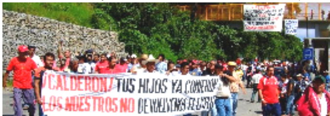
Unión de Defensores y Promotores de Derechos Humanos de la Sierra Norte de Puebla 15 de diciembre de 2009

Desde octubre del presente año, con el decreto de extinción de Luz y Fuerza del Centro, en la región de Huauchinango-Nuevo Necaxa, Puebla, se ha estado viviendo un ambiente tenso. La Policía Federal Preventiva tomó las instalaciones de Luz y Fuerza del Centro, una empresa que generaba empleo para toda la región, generando una fuente económica muy fuerte. Un 95% de la población de Nuevo Necaxa dependía de esta empresa, el comercio de este pueblo dependía de los trabajadores de Luz y Fuerza del centro y algunas comunidades dependían al 100%. Esta región no fue la excepción, llegaron un gran número de ele-