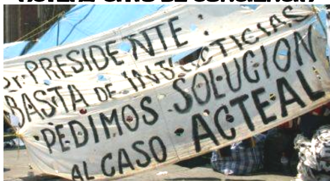
TIERRA SAGRADA DE LOS MÁRTIRES DE ACTEAL, Chenalhó, Chiapas, México 22 de Diciembre de 2009

Hoy a 12 años de suceder la Masacre de Acteal, en la que perdieron la vida 45 personas y 4 más que aún no nacían, autoridades civiles y militares de nuestro país han perpetrado este Crimen de Estado dejando impunes a quienes sirvieron a la estrategia contrainsurgente implementada en Chiapas.