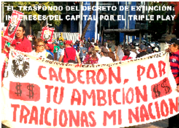
SINDICATO MEXICANO DE ELECTRICISTAS. COMITÉ CENTRAL Y COMISIONES AUTONOMAS. México D.F. a 4 de Enero de 2010

Impuesto por la vía del fraude electoral y a tres años de su des-gobierno, Felipe Calderón constituye una pesadilla interminable para el pueblo de México: inseguridad pública, delincuencia y narcotráfico, crisis de las finanzas públicas, soberanía vulnerada, violación sistemática de derechos humanos, retroceso social y económico, desempleo, etc. Estos problemas, lejos de resolverse, se han exacerbado y tienen como resultado niveles de miseria y pobreza nunca antes ocurridos en la historia contemporánea de México. Los únicos beneficiados han sido un puñado de grandes empresarios y empresas transnacionales que han visto acrecentar sus multimillonarias fortunas frente a los miserables salarios con los que sobreviven los trabajadores en México.