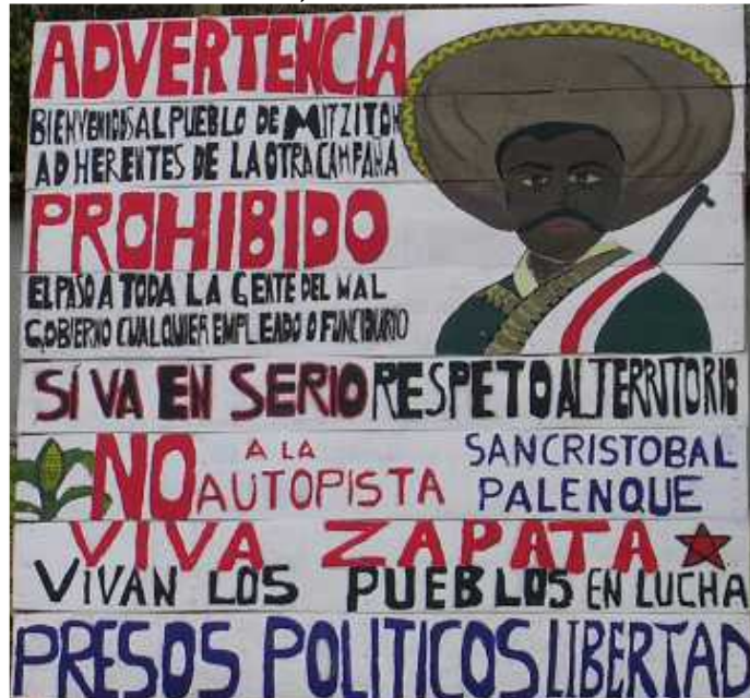
a 22 de marzo de 2010.

citaremos, porque a poco no ha leído nuestras denuncias y no ha visto los verdaderos problemas que tenemos en nuestra comunidad. Nosotros no aceptamos ningún dialogo con el mal gobierno, sabemos muy bien cuáles son sus intereses, no nos extraña que él que se dice defensor de los derechos humanos le sirva a hora al mal gobierno como su palero, no nos van a seguir engañando. El mal gobierno bien lo sabe cuáles son nuestros acuerdos que tenemos en nuestra comunidad, lo hemos denunciado muchas veces que ya no queremos que los paramilitares y delinquentes sigan haciendo daño y que se los lleve, que respete nuestros derechos como pueblo indígena que somos. Que no sigan maquillando la violencia del mal gobierno que nos hace en nuestra comunidad por problemas religiosos y de pugnas. Nosotros no somos un grupo, somos un pueblo que merecemos respeto.