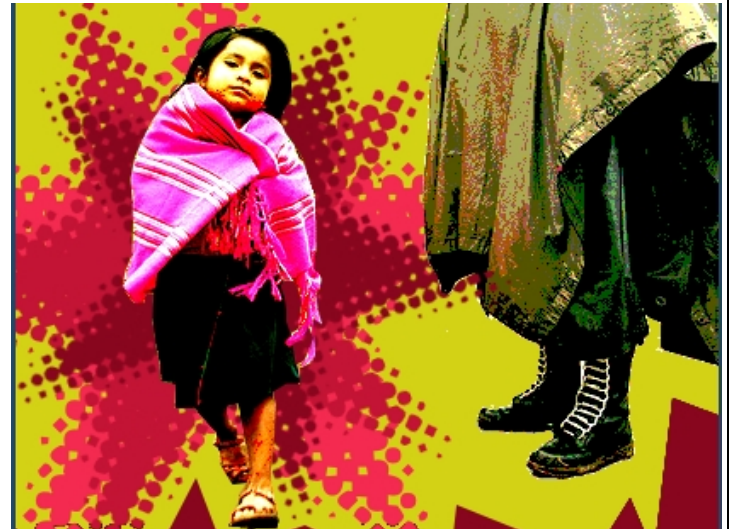
Chiapas México, a 16 de marzo 2010.

A L@S COMPAÑER@S DE LA SEXTA INTERNACIONAL A L@S COMPAÑER@S DE LA OTRA CAMPAÑA DE MÉXICO Y DEL MUNDO A LOS COMPAÑEROS Y COMPAÑERAS DE LOS MEDIOS ALTERNATIVOS A LOS HERMANOS Y HERMANAS DE MÉXICO Y DEL MUNDO AL ORGANISMO DE DERECHOS HUMANOS NACIONAL E INTERNACIONAL CONSECUENTE Y HONESTO,