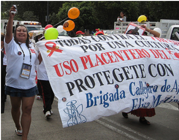
AMENAZAS DE PADROTES Y POLICÍAS POR IGUAL NO SOMOS VÍCTIMAS DE NADIE, SOMOS TRABAJADORAS "NO HAY CONFIANZA HACIA EL GOBIERNO": TRABAJADORAS SEXUALES.