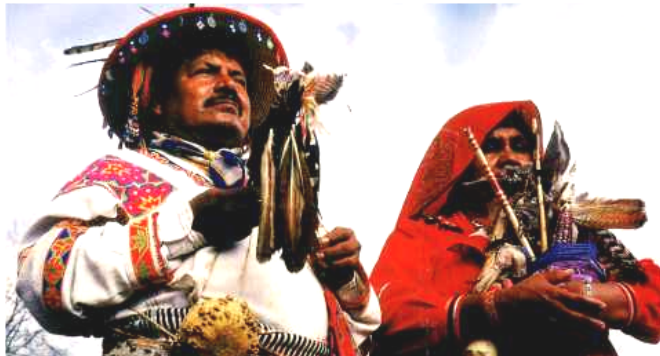
Santa María Ostula, Aquila, Mich., a 22 de abril de 2010.