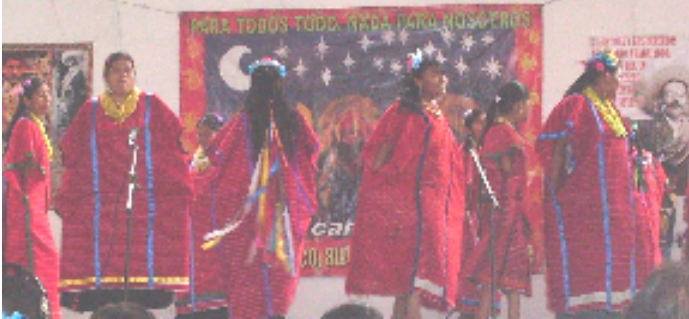
Oaxaca de Juárez, Oax; a tres de agosto de dos mil diez.

A LOS MEDIOS DE COMUNICACION A LOS PUEBLOS DE MEXICO Y EL MUNDO A LAS ORGANIZACIONES SOCIALES Y DE DERECHOS HUMANOS A LA OTRA CAMPAÑA