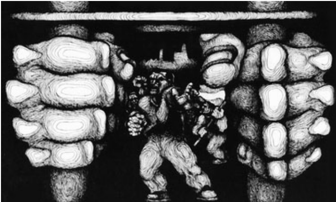
COLECTIVO CONTRA LA TORTURA Y LA IMPUNIDAD. TALLER DE DESARROLLO COMUNITARIO AC. BOLETIN DE PRENSA, Acapulco, Gro., 1º de octubre del 2010.