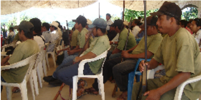
PRONUNCIAMIENTO CONJUNTO DE ORGANIZACIONES Y COMUNIDADES ASISTENTES 15 de octubre 2010, San Luis Acatlán, Guerrero, Territorio Comunitario.

En el marco del XV aniversario de la Coordinadora Regional de Autoridades Comunitarias (CRAC-PC), las organizaciones sociales asistentes, confluimos en este espacio para encontrarnos, intercambiar experiencias y formas de luchas con la finalidad de solidarizarnos y articular los procesos organizativos que nos permitan caminar de manera colectiva y hacer realidad nuestros derechos.