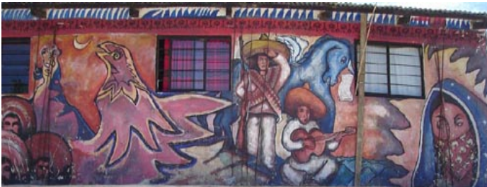
JUNTA DE BUEN GOBIERNO CORAZON CENTRICO DE LOS ZAPATISTAS DELANTE DEL MUNDO

ASUNTO: DOCUMENTO ACLARATORIO. 13 de octubre 2010.