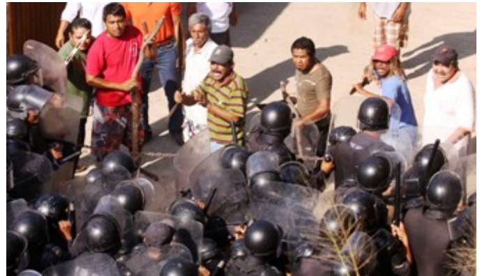
COMUNICADO DE PRENSA DEL 10 DE NOVIEMBRE DEL 2010