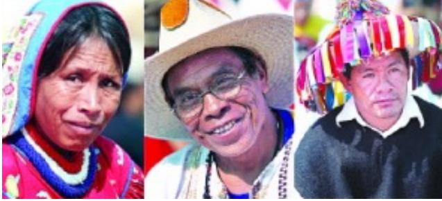
Vícam, Territorio de la Tribu Yaqui, a 21 de noviembre de 2010.

Reunidos en la Casa del Yaqui los pueblos, tribus y naciones Purépecha, Nahuatl, Wixárika, Coca, Odham, Yaqui, Mayo-Yoreme, Mixteco, Triqui, Tzotzil y Otomí, junto con integrantes de la sociedad civil mexicana y de diversos países de América, Asia y Europa para celebrar el Primer Foro Nacional e Internacional en Defensa del Agua , y reconociendo que: