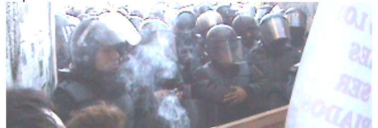
ATENTAMENTE: FRENTE AMPLIO CONTRA LA SUPERVÍA PONIENTE DE CUOTA EN DEFENSA DEL MEDIO AMBIENTE

Cuando no se tiene la razón, se reprime y se utiliza la fuerza, como el día de hoy, en que una vez más, nos violaron nuestro derecho a la seguridad jurídica, a la integridad personal y al libre tránsito. Sin embargo, el Frente Amplio mantendrá su defensa por la Ciudad de México y reitera su disposición al diálogo serio, público, respetuoso.