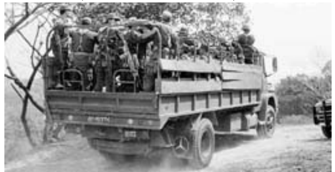
Chilpancingo, Guerrero, a 7 de diciembre del 2010