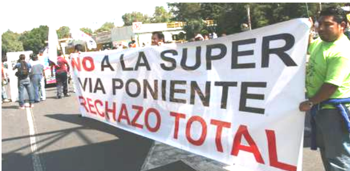
FRENTE AMPLIO CONTRA LA SUPERVÍA PONIENTE DE CUOTA EN DEFENSA DEL MEDIO AMBIENTE. BOLETÍN DE PRENSA N° 40, 1° de enero de 2011.

* CUANDO NO SE TIENE LA RAZÓN, SE IMPONE POR LA FUERZA.