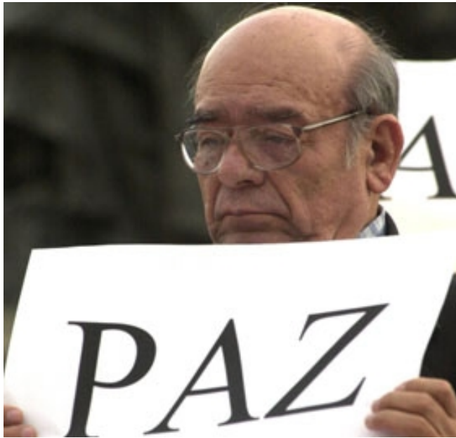
México, Marzo de 2011

Reciban nuestros saludos. Antes que nada queremos agradecer al Centro de Derechos Humanos Fray Bartolomé de Las Casas AC invitación que nos hicieron para mandar un compañero mensaje a su Asamblea Nacional.