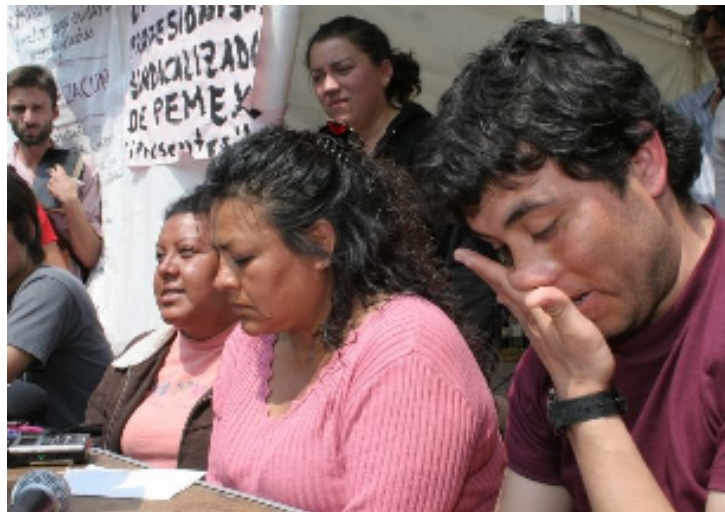
Ciudad de México, a 25 de marzo de 2011.