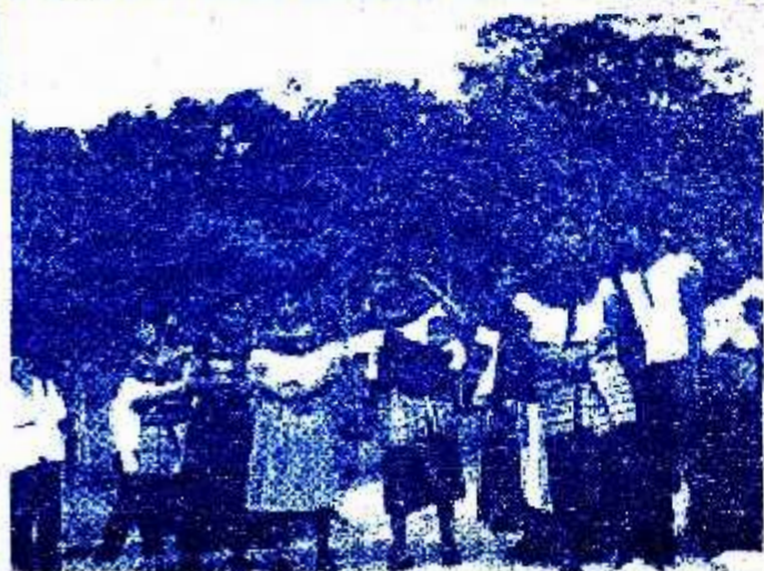
San Sebastián Bachajón, adherentes a la Otra Campaña, Sexta Declaración de la Selva Lacandona. Chiapas, México.

A los organismos defensores de derechos humanos nacional e internacional A los medios de comunicación masivos y alternativos