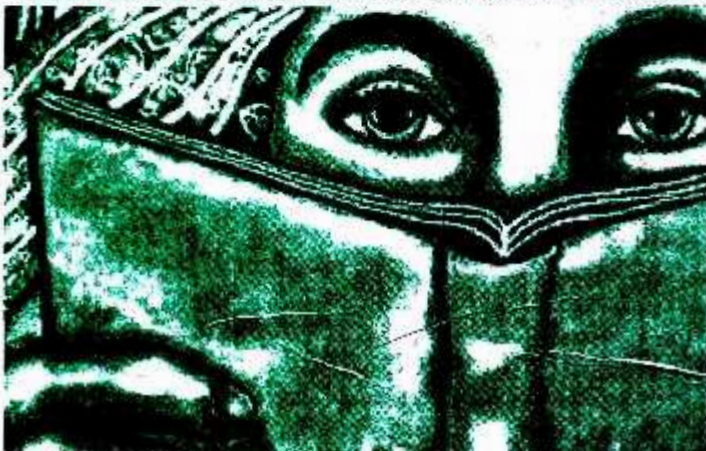
Centro de Medios Libres de la Ciudad de México Jueves, 31 Enero 2013

Presentamos un resumen de 3 de los comunicados donde van definiendo una serie de 30 propuestas, los del 30 de diciembre, 26 y 29 de enero.