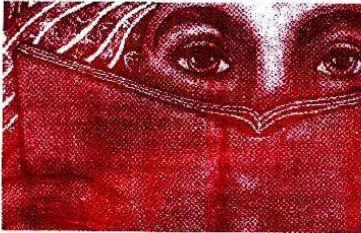
La Voz del Anáhuac

Entre agosto y diciembre de 2013 y enero de 2014 se llevó a cabo en territorio zapatista, en el Cideci y en diferentes lugares en forma de videoconferencias el Primer Curso de la Escuelita Zapatista: La libertad según l@s zapatistas .