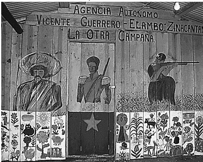
Centro de Medios Libres 13 diciembre, 2015

A los adherentes La Sexta Nacional e Internacional A los defensores de los derechos humanos A los medios de comunicación alternativos A la sociedad en general