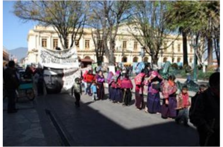
Fragmento de Comunicado de desplazados de Shulvó Adherentes de la Sexta Febrero de 2016

Como parte del terrorismo de Estado, en Chiapas, los grupos paramilitares vuelven a hacer presencia en las comunidades organizadas agrediendo a los compañeros de las distintas organizaciones, dentro de estas agresiones por parte de grupos afines al gobierno estatal se encuentra nuestro caso, donde los caciques priístas nos han desplazado de manera forzada de nuestra comunidad de Shulvó, municipio de Zinacantán, y que hasta este momento 46 personas vivimos en condiciones deplorables, sin poder retornar a nuestras casas, y las cuales fueron dañadas por órdenes de los agentes rurales, y representantes priístas de la misma comunidad de Shulvó.