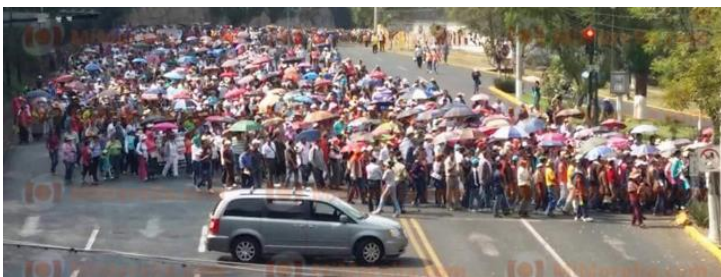
Centro de Medios Libres 11 diciembre, 2015

10 de diciembre de 2015.- Nubes de policías fuertemente armados atacan las manifestaciones de profesores y estudiantes normalistas que defienden la educación pública y gratuita a lo largo y ancho del país, mientras los grupos de la delincuencia organizada continúan asolando a la población