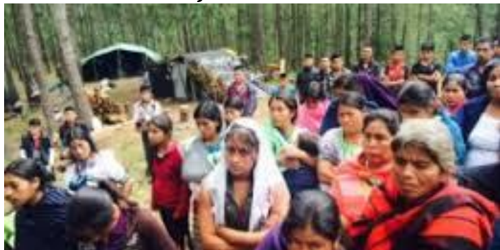
La Voz del Anáhuac Febrero de 2016