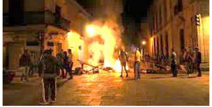
Agencia SubVersiones, 12 junio, 2016

El sábado 11 de junio del año 2016, aproximadamente a las 11 de la noche, más de 1,000 elementos de la policía estatal desalojaron con lujo de violencia a los profesores de la Sección XXII del Sindicato Nacional de Trabajadores de la Educación (SNTE). Los docentes se encontraban en plantón frente a las instalaciones del Instituto Estatal de Educación Pública de Oaxaca (IEEPO) como medida de presión para que se instale una mesa de negociación con el gobierno federal y discutir la reforma educativa implementada en México. A su vez los profesores de la Coordinadora Nacional de Trabajadores Especial (CNTE) están en paro desde el 15 de mayo.