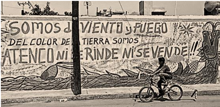
Comentario de La Voz del Anáhuac.

Contra la voluntad de los pueblos, violando sus propias leyes, el Estado mexicano y las empresas constructoras del Nuevo Aeropuerto Internacional de la Ciudad de México siguen empeñadas en llevar a cabo esa megaobra inviable. La naturaleza misma de los terrenos en que se pretende construir este aeropuerto ha evidenciado que no es propicia para la construcción de un aeropuerto, pues inevitablemente ocurrirán severos hundimientos, de acuerdo a estudios realizados por académicos, investigadores, topógrafos, ecologistas y otros especialistas.