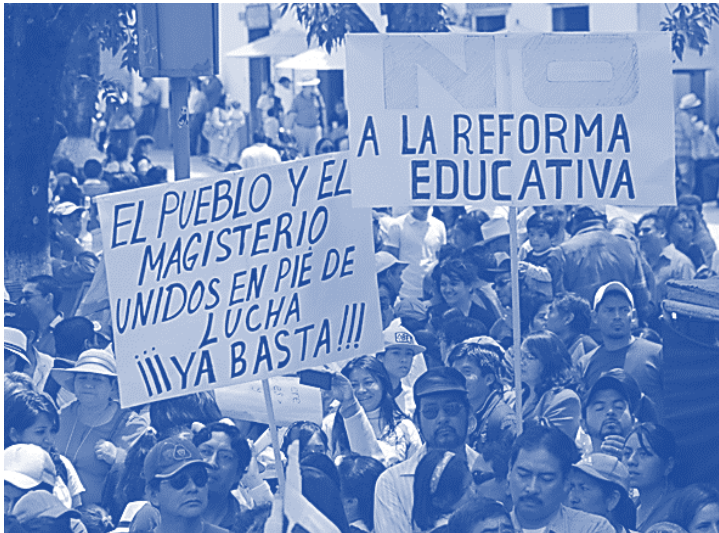
(Comunicado del EZLN, México, mayo del 2016.)