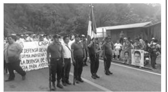
Redacción Desinformémonos 17 octubre 2017

G uerrero, México. | Desinformémonos. La Policía Comunitaria de Guerrero celebró su XXII aniversario en la comunidad de Colombia de Guadalupe, hasta donde llegó una comisión de padres de los normalistas desaparecidos de Ayotzinapa y estudiantes de la normal, así como organizaciones sociales que refrendaron su apoyo a la organización comunitaria encargada desde hace más de dos décadas de brindar seguridad a la Montaña y Costa de Guerrero. En la celebración hubo comida comunitaria, un festival que incluyó bailes regionales y un desfile de autoridades del pueblo e invitados.