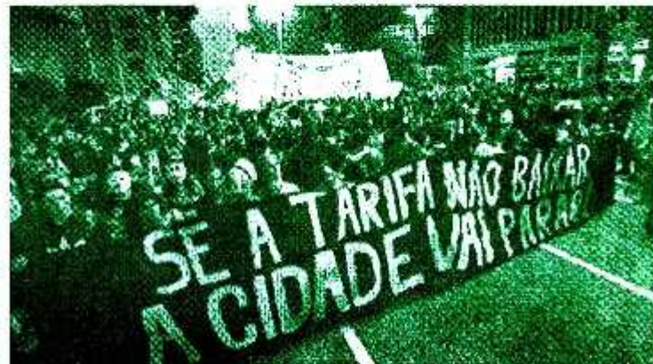
Organización anarquista Tierra y Libertad OA Terra e Liberdade 18 de junio de 2013

En comparación con el escenario de la final de la dictadura militar de los años 90, se puede decir, en el análisis de los movimientos sociales de hoy, todavía estamos recuperando de los efectos de PT / PCdB y su manejo de la situación.