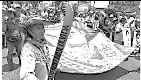
Frente de Pueblos en Defensa de la Tierra

A los medios de comunicación, A los organismos de derechos humanos nacionales e internacionales, A la solidaridad nacional e internacional: