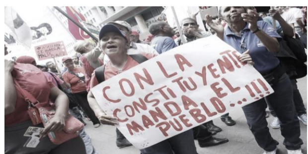
Atilio Boron. 01 agosto, 2017

Pocas veces se celebraron elecciones en un contexto tan signado por la violencia como las de este domingo pasado en Venezuela. Hay pocas experiencias similares en el Líbano, Siria e Irak. Tal vez en los Balcanes durante la desintegración de la ex Yugoslavia. Dudo que en algún país europeo o mismo en Estados Unidos se hubiera celebrado elección alguna en un contexto similar al venezolano. Por eso que algo más de ocho millones de personas hayan desafiado a la derecha terrorista con sus sicarios, pirómanos, saqueadores y francotiradores y concurrido a emitir su voto demues-