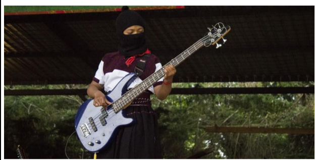
Radio Pozol (texto) 02 agosto, 2017

“Contra el capital y sus muros, todas las artes”