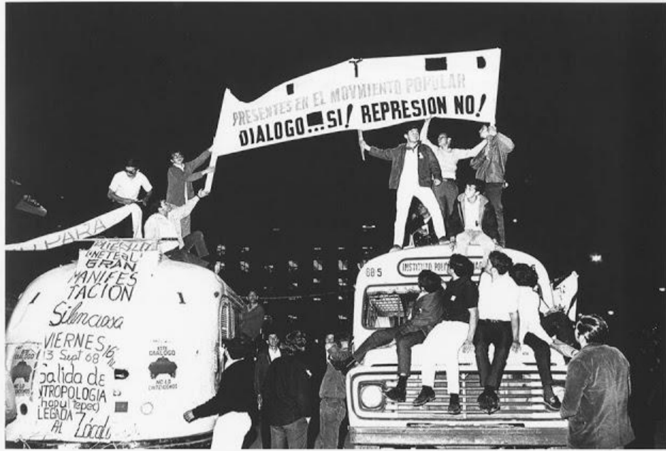
¡MEDIO SIGLO! Cinco décadas: 50 años., pero la rebeldía nuestra sigue de pie. La Voz del Anáhuac, Doroteo Arango, febrero, 2018

¡ M edio siglo y seguimos! Cuando comenzó el movimiento, sabíamos del riesgo que correríamos desde la represión del 26 de julio, desde el bazucaso, pero pudo más la rebeldía nuestra, que no terminó el 2 de octubre, como dice la historia oficial. La huelga resistió hasta diciembre. No nos dimos por vencidos. Seguimos todavía como movimiento estudiantil hasta 1971.