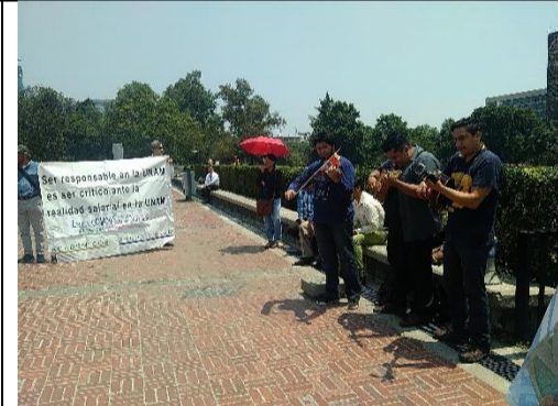
Por Club Proletario Julio Chávez López La Voz del Anáhuac/Trabajadores y Revolución 15 de mayo del 2018

Este 14 de mayo, un día antes del día del maestro se congregaron en un mitin en la explanada de rectoría de la UNAM trabajadores académicos de la UNAM pertenecientes al Colegio de Ciencias y Humanidades, la Escuela Nacional Preparatoria de los diferentes planteles además de integrantes de las facultades de Contaduría y Arquitectura.