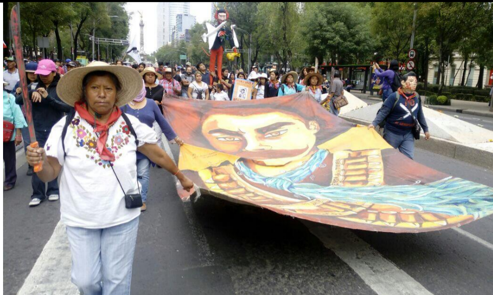
por Doroteo Arango La Voz del Anáhuac/Trabajadores y Revolución 04 de mayo de 2018.

E l viernes 4 de mayo nuestros hermanos del Frente de Pueblos en Defensa de la Tierra nuevamente marcharon del Ángel de la Independencia al Zócalo refrendando su compromiso de lucha contra el nuevo Aeropuerto Internacional de la Ciudad de México, ese megaproyecto de muerte que los gobiernos federal, estatal y municipales insisten en imponer a los pueblos que viven, trabajan, resisten, luchan a la orilla del agua.