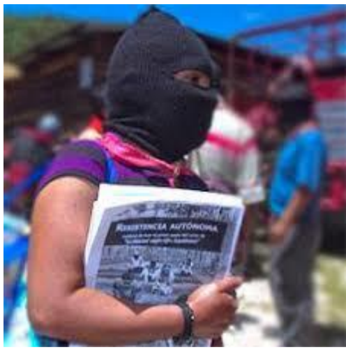
MÉXICO, ABRIL-MAYO 2019