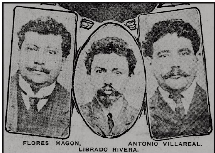
FLORES MAGÓN, LIBRADO RIVERA, ANTONIO VILLAREAL.